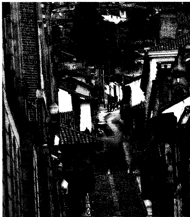
FAVELE, OGRADJE IN BODEČA ŽICA SO LE ENA, NEKOLIKO NADLEŽNA, A POVSEM MESTA

Vlada RS je prejšnji teden sprejela sklep in v nadaljevanju z županom MOL Zoranom Jankovičem že tudi podpisala veljavno pogodbo o prenosu ustanoviteljskih pravic in obveznosti do javnega zavoda Arhitekturni muzej Ljubljana (AML), s katero je MOL neodplačno prenesla opremo in premično premoženje (z